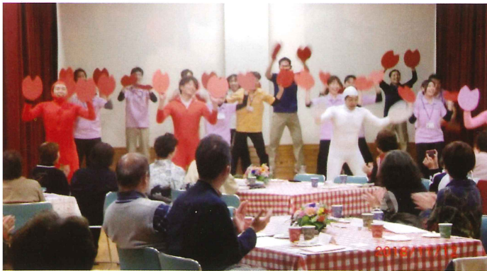
職員による歌「恋のバカンス」とダンス「エビカニックス」

これからも利用者の皆様の潤いある暮らしの支えとしてご来苑いただけますよう心よりお待ち申し上げます。